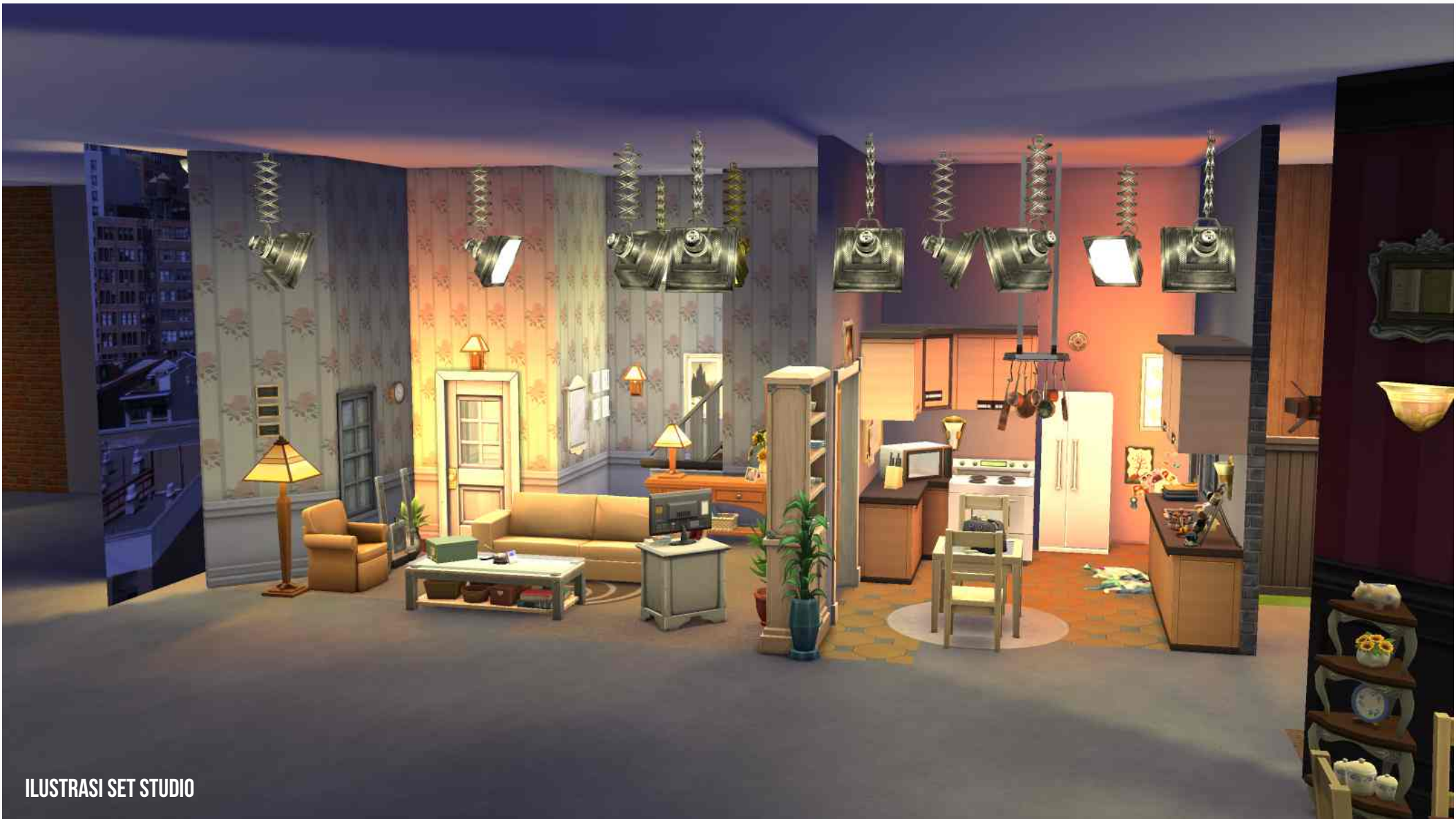
ILUSTRASI SET STUDIO